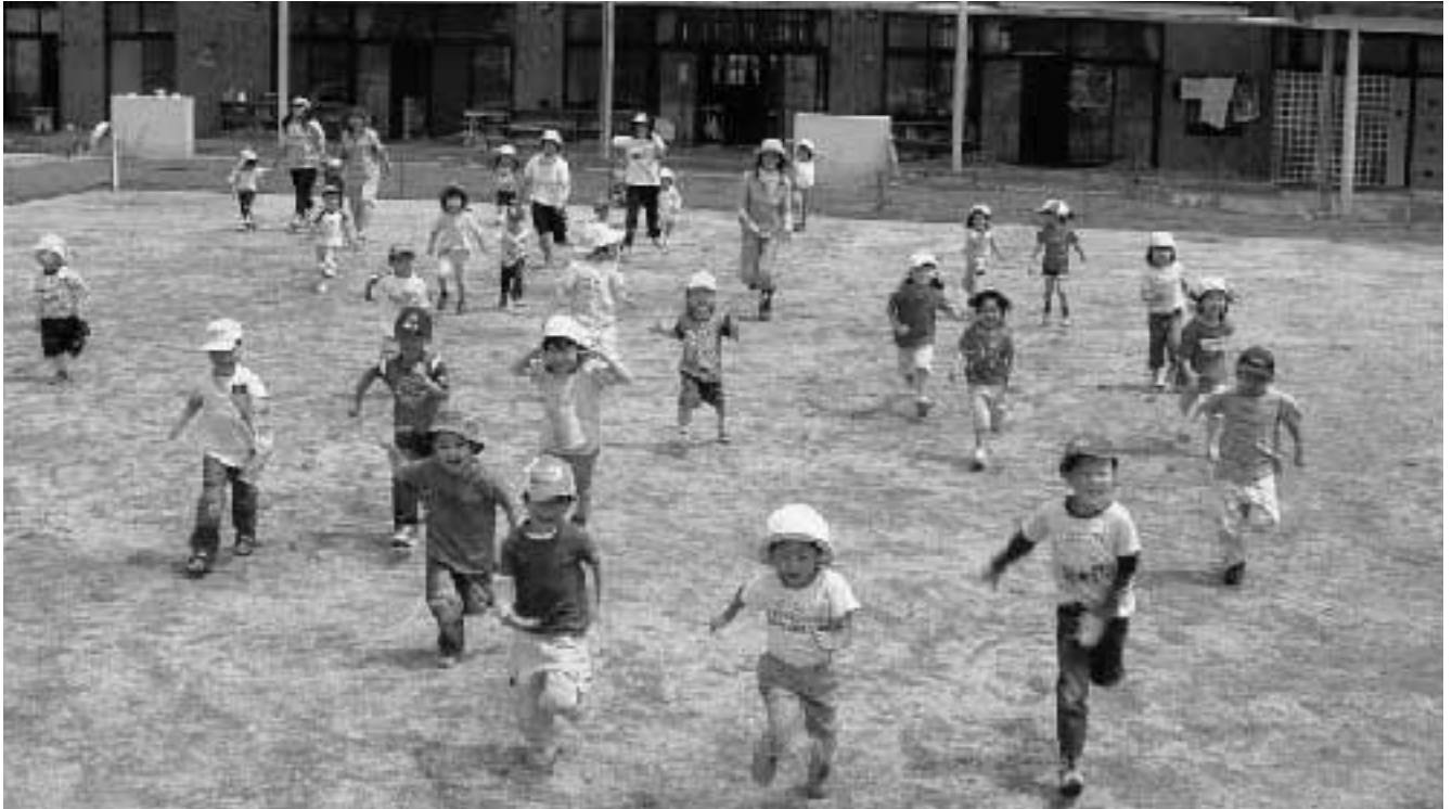
元気いっぱい園児たち