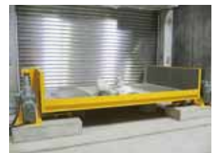
⑤ 「ダンピングボックス」