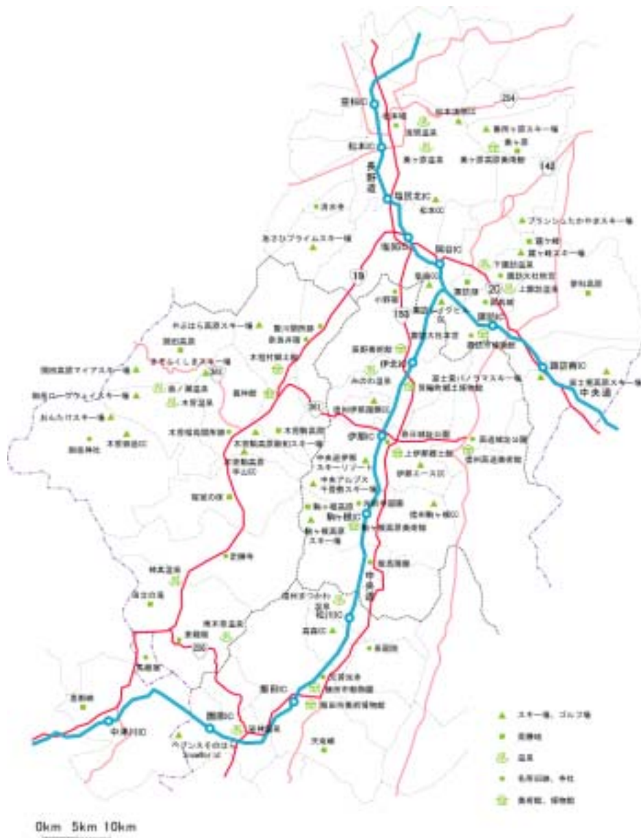
図 7-2 木曾・伊那地域の観光地