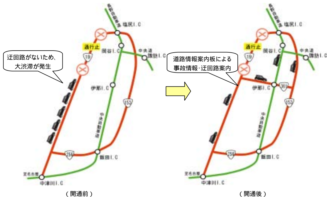
図 0-2 伊那木曾連絡道路開通後の迂回状況

伊那木曾連絡道路が開通することにより、国道 19 号で事故による通行止めが発生した場合においても、伊那木曾連絡道路を迂回路として利用することができる。