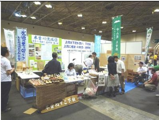
木曽広域連合（みんなの会）