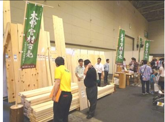
木曽官材市売協同組合