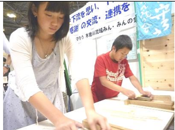
箸づくり体験の様子