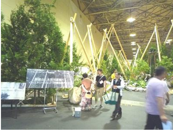
御嶽山と木曽川流域のイメージアート