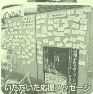
いただいた応援メッセージ