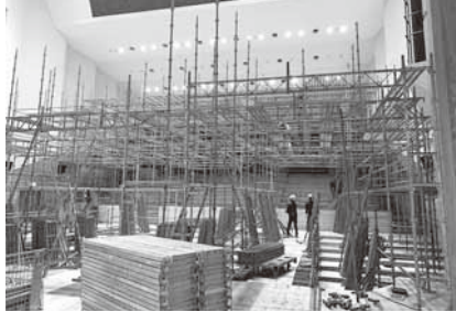
足場が組まれたホール

令和3年11月に始められた工事は、まず劣化していた客席の椅子を全て撤去し、ホール全体に天井まで届く足場を設置しました。その後、吊りボルトで固定された天井板も全て撤去し、新たに追加した天井裏の鉄骨に新しい天井板を直接張り付けました。