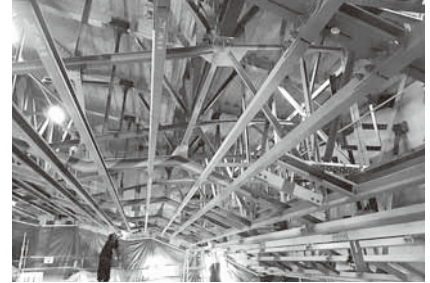
天井裏の補強を実施