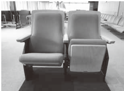
新たに設置される客席の椅子

今後は床の仕上げ工事を行うとともに、安全性や鑑賞性能に配慮した椅子の設置を行い、7月末のしゅん工を目指して工事を進めています。