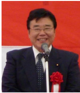
来賓あいさつ 後藤 衆議院議員