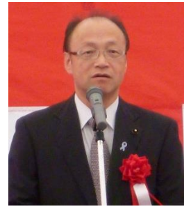
来賓あいさつ 村上 長野県議会議員