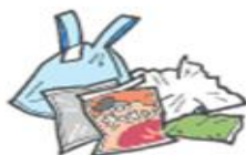
レジ袋・お菓子の袋など