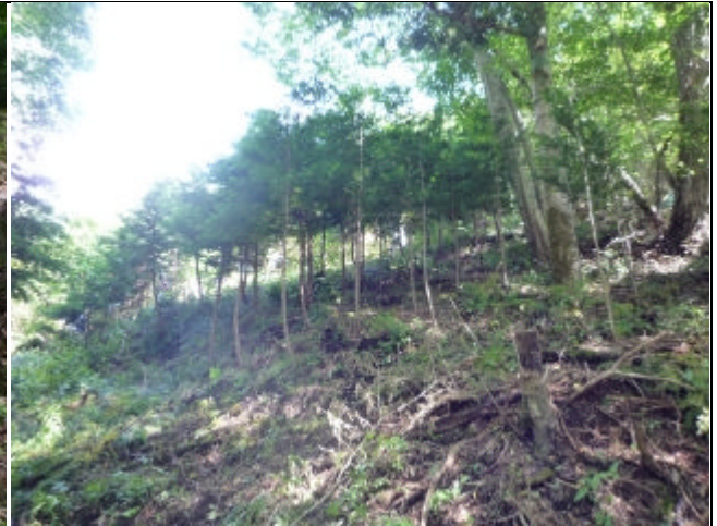
作業後の水源の森