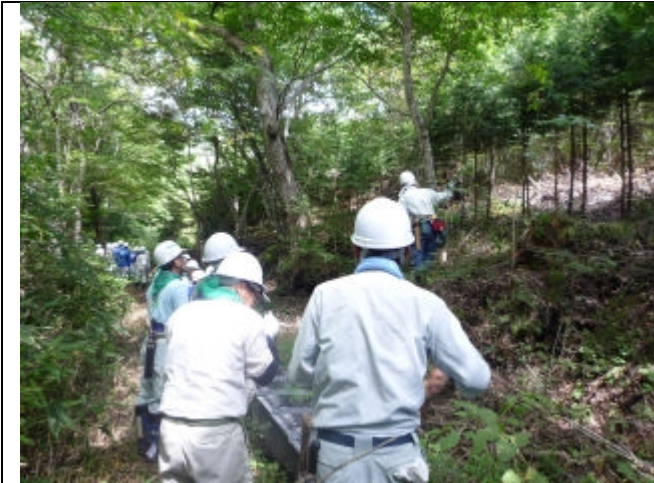
作業前の水源の森