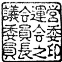
議会運営委員会 委員長印