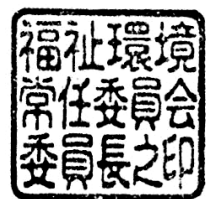
福祉環境常任委員会 委員長印