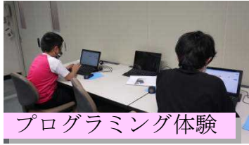
プログラミング体験

4年生以上が、自分で選択し、異年齢集団での活動をしながら、個性の伸長を高める時間です。今年度は「工作」「ダンス」「室内ゲーム」「運動」「家庭科」の5つのクラブがあり、みんな生き生きと取り組んでいます。