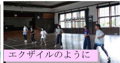
エクザイルのように