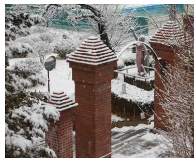
春はもうすぐ・・・。