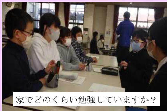
家でどのくらい勉強していますか？

全校の前でも自分の考えを堂々と発表しあう児童総会。中学校生活についてのオリエンテーションでは6年生の質問に一生懸命答える中学1年生。相手を思いやって「聴く」「話す」のキャッチボールができています。