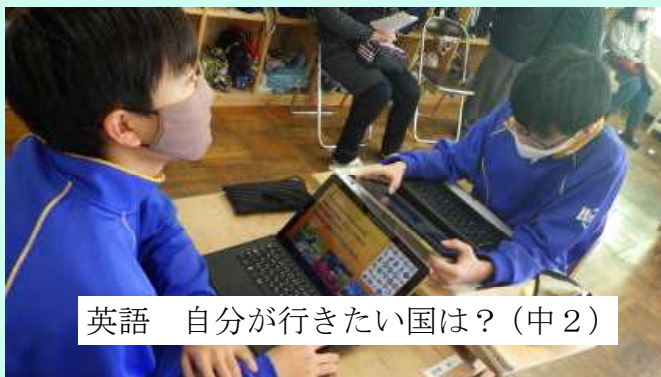
英語 自分が行きたい国は？ (中2)