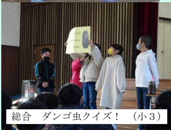
総合 ダンゴ虫クイズ！ (小3)