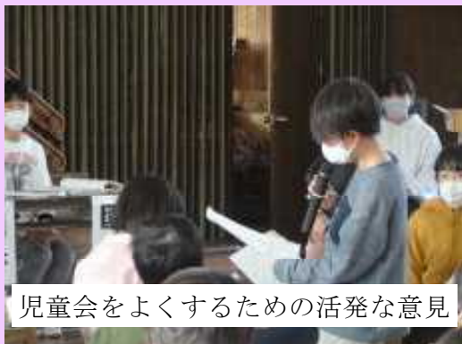
児童会をよくするための活発な意見