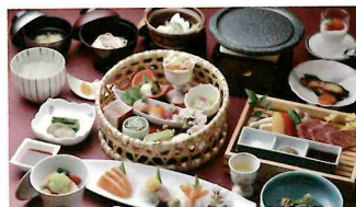
グレードアップ会席 信州産牛の石焼を中心に、 品数も増えたコースです。

*料理写真は一例です。献立は季節や仕入れ状況等により変更される場合がございます。 *馬刺し、信州サーモン炙りたたき、信州産牛炙り寿司など、各種別注料理も当日19時まで承っております。 (別注料理は仕入れ状況により売切れの場合もございます)