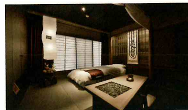
湯端館 真田戦国部屋 定員 1名様