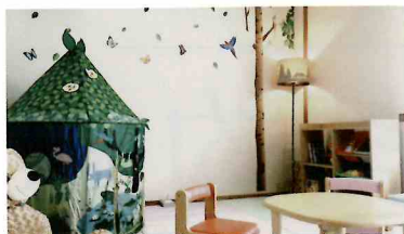
御坂館 ファミリールーム 定員 2名様 - 4名様

そのほか湯端館には、1-2名様 向けのカジュアル和室8畳、 1名様向けのカジュアル洋室が ございます