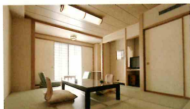
御坂館 コンフォート和室10畳 定員 1名様 - 3名様