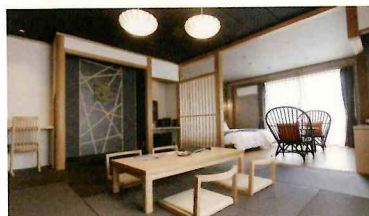
御坂館 セミスイート和洋室 定員 2名様 - 5名様