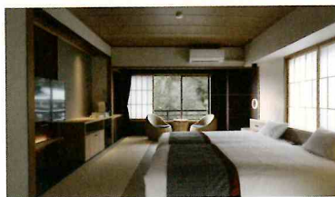
湯端館 プレミアム和洋室 定員 2名様