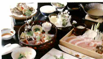
スタンダード会席 こだわりの信州産豚を、 特製の豆乳鍋で。 (平日のみご提供)