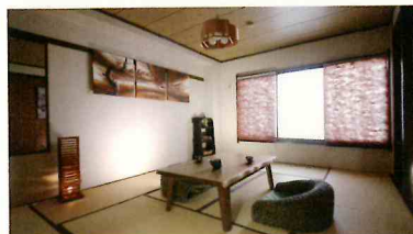
湯端館 レディースルーム 定員 1名様 - 4名様