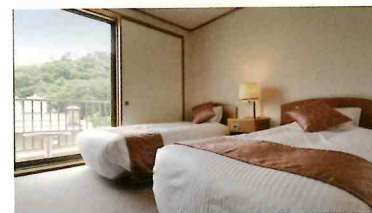
御坂館 コンフォート和洋室 定員 2名様 - 5名様