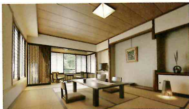
湯端館 スタンダード和室12畳 定員 2名様 - 4名様