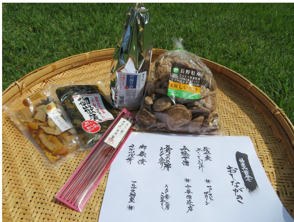
長野県 木曾郡セット