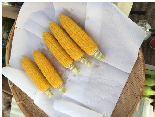
蒸したてトウモロコシ