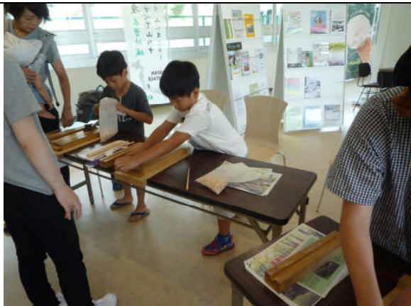
箸作り体験の様子① (8/21)