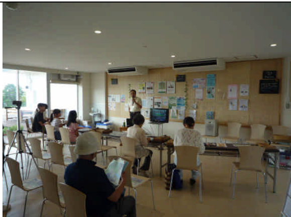
スライド説明の様子 (8/21)