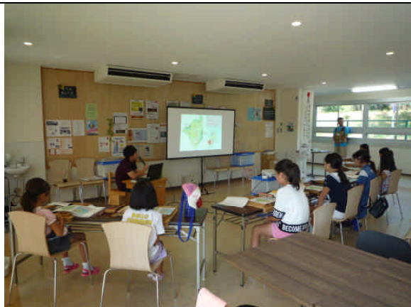
スライド説明の様子 (8/30)