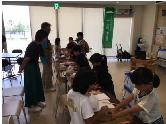
箸作り体験の様子② (8/30)