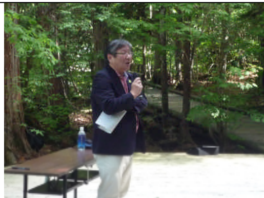
上松町長あいさつ