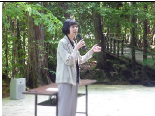
名古屋市副市長あいさつ