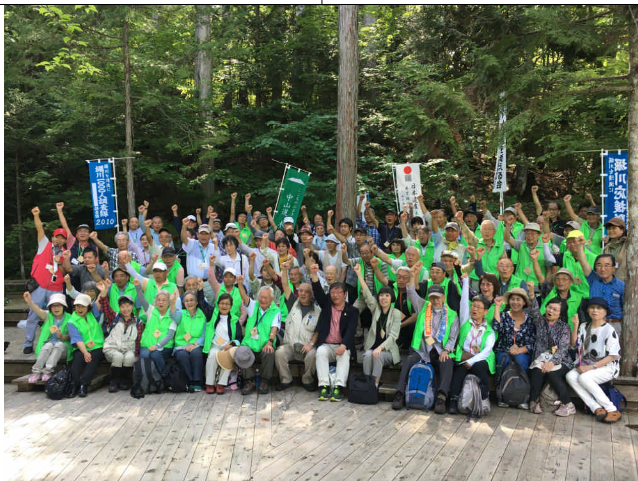
参加者全員での集合写真