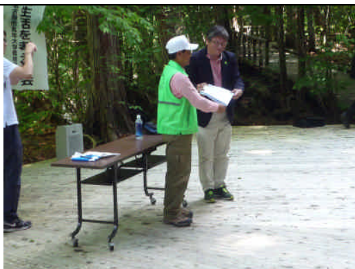
エール交換の様子（下流域から上流域へ）