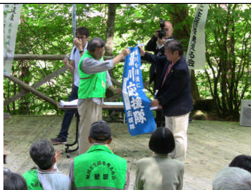
エール交換（上流域から下流域へ）