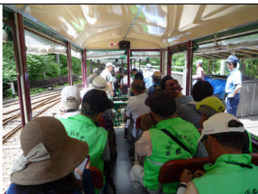
森林鉄道乗車の様子