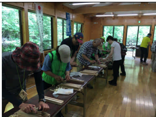
箸づくり体験の様子