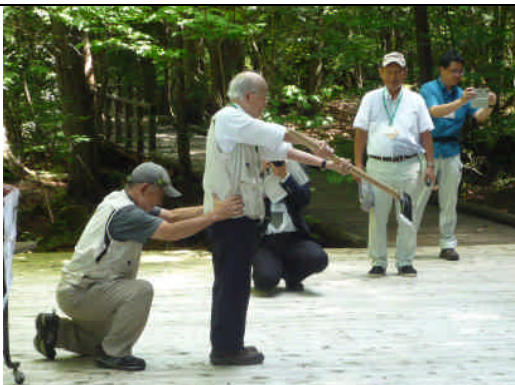
交流会の様子（御杣始祭の再現）