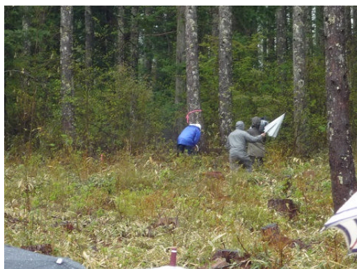
伐倒デモンストレーション