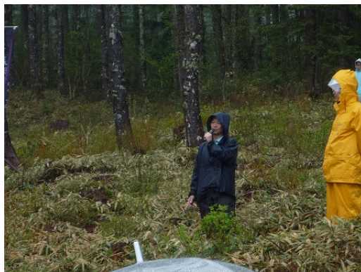
名古屋城総合事務所西野所長あいさつ