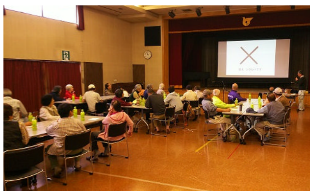
とことんコース「森林教室」の様子