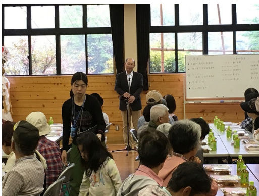
大桑村貴舟村長より歓迎のあいさつ