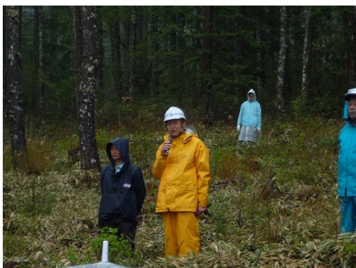
原 木曾町長・連合長あいさつ