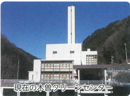
現在の木曾クリーンセンター

平成28年2月29日の木曾広域連合議会において工事請負契約の締結が可決され、木曾クリーンセンター新ごみ処理施設建設工事が始まります。